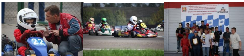
ФОТО ЮНЫХ КАРТИНГИСТОВ